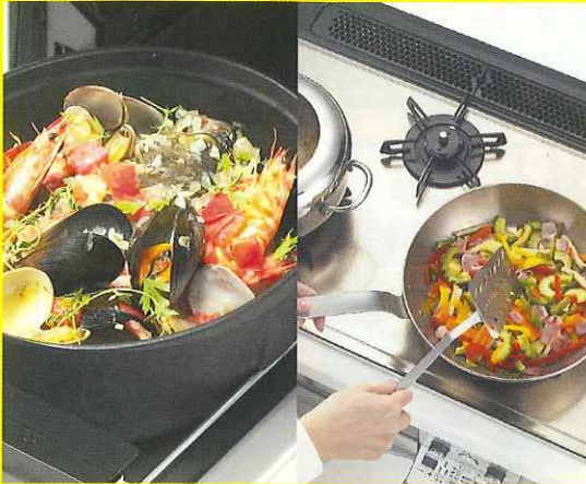
写真はイメージです。