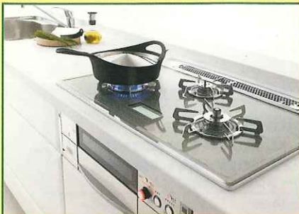
システムキッチン [エスタジオ] つくること、食べることも、もてなすことが愉しめるキッチン。