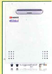
ガス給湯器 [エコジョーズ] ふるも給湯も高効率化した2つのエコ。