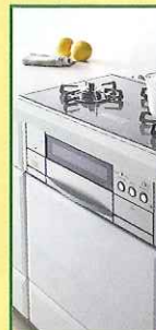
ビルトインコンロ 暮らしにぴったり、使いやすさにこだわったコンロ。