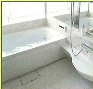
システムバス [クレッセ] お風呂の快適を考えると「クリーン&エコ」になる。